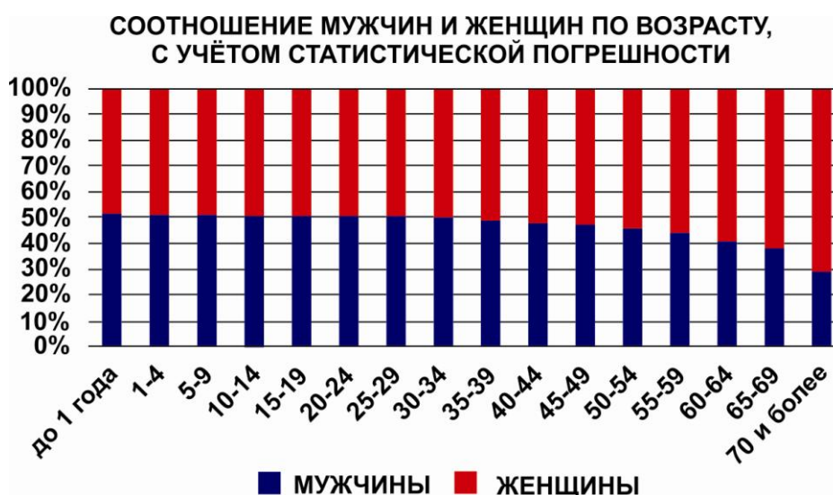
Изобр. 1. Статистика о рождаемости, по данным Росстата [2; 9]

Так, обратившись к статистическим данным о рождаемости (см. Изобр.1), выяснится факт того, что разнополые люди, как и иные представители земной фауны, рождаются в строго определённой пропорции, а именно 50/50 % [2; 7, с. 27-28; 9]. Иными словами, в природе, каждой особи, предназначена своя вторая половина противоположного пола, которую всего лишь следует отыскать.